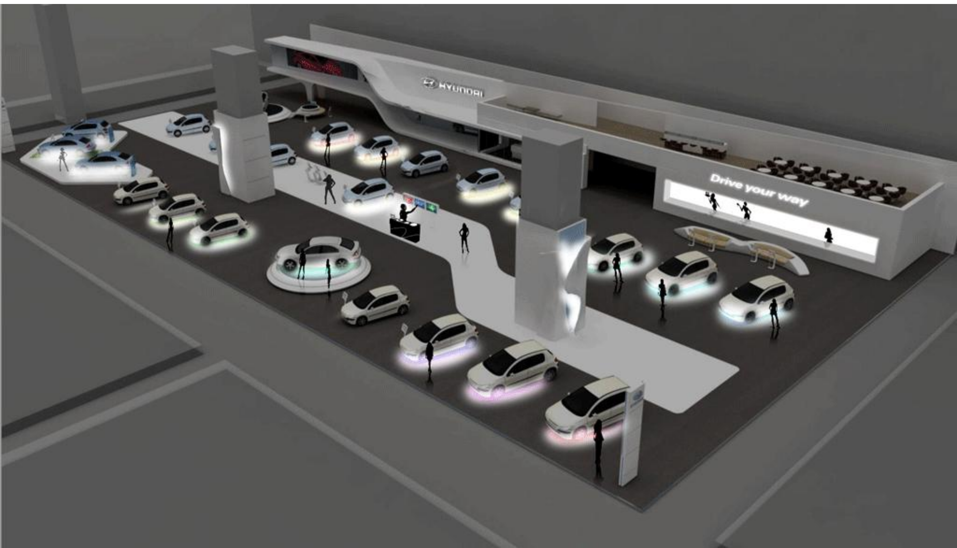
Схема расстановки авто