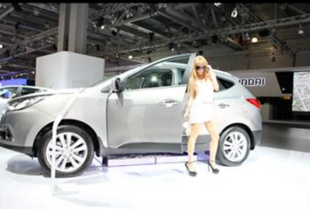
Фото с мероприятия